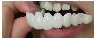
Veneer Ini 300 Kali Lebih Baik dari Gigi Palsu!