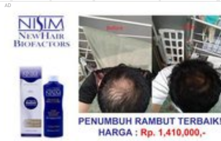
Nisim Rp 1,410,000,- Rambut jadi Tebal dan Atasi