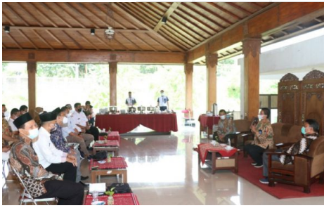
PUI Javanologi UNS Siapkan Bahasa Jawa Untuk