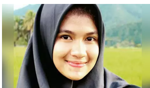
Gadis Ini Berusia 53 Tahun. Ditemukan Resep Peremajaan Wajah