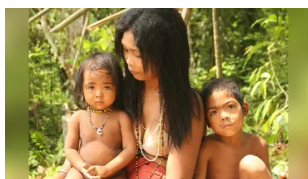
Suku Pedalaman Baduy sudah Biasa; 5 Ini Pasti Kamu belum Tahu