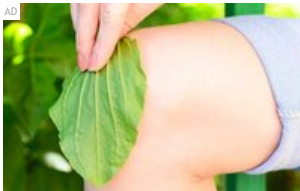
Hindari nyeri lutut selamanya! Bacalah