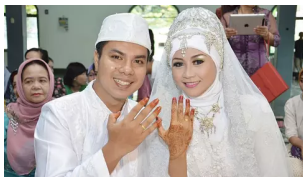
Pengantin Wanita Ini Terlihat 29 tapi Aslinya 64 Tahun, Kok Bisa?