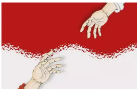
Agama di Kehelusan Budaya