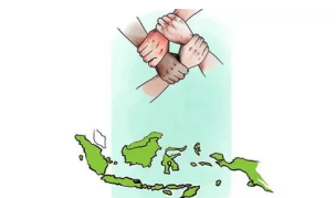
Seberapa Absurd Adab Bahari Kita