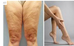
Siswi genius Jakarta temukan obat bakar lemak 7kg sehari