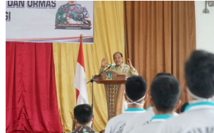
Wali Kota Tebingtinggi Ajak Generasi Muda Tanam Wawasan