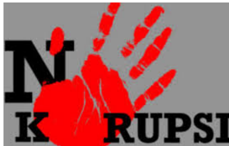
RUU Perampasan Aset Jadi Suplemen