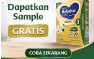
Gratis Sample! Bebelac Soya Perut Sehat Untuk si Kecil