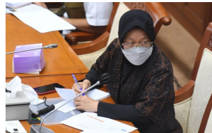
Mensos: Perpustakaan Bisa Mengubah Hidup Seseorang