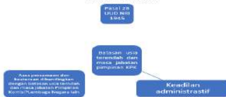
Gambar 2 Mind Mapping Pengaturan Batasan Usia Terendah dan Masa Jabatan Pimpinan Komisi/Lembaga Negara

Pengaturan mengenai syarat usia bagi pimpinan Komisi/Lembaga Negara dan masa jabatannya berada di ranah norma hukum administrasi negara sektoral. Francisco Esparaga dan Ian Ellis-Jones (2011:1) mengingatkan bahwa Hukum Administrasi Negara harus mampu mewujudkan keadilan administratif ( administrative justice ) yang unsur-unsur pokoknya ( core elements ) meliputi: keabsahan ( lawfulness ), keadilan ( fairness ) dan rasionalitas ( rationality ) dalam penggunaan kekuasaan publik. Baik jika pengaturan mengenai syarat batasan usia terendah dan tertinggi bagi KPK RI mengandung unsur-unsur pokok keadilan administratif tersebut sehingga menghindari terjadinya diskriminasi pengaturan.